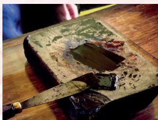
Joris Munier, fragment de l'atelier d'Isabelle sauvage